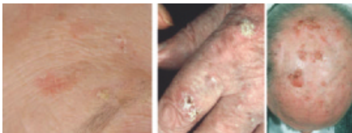
► Abb. 4.1 Aktinische Keratose vom überwiegend keratotischen Typ (Moll 2010).

Vorrangig bei Männern entwickelt sich die Verhornung an den Ohren und an der Stirn zeitweilig so stark, dass sich ein „Hauthorn“, ein Cornu cutaneum , bildet.