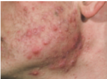
► Abb. 3.1 Acne papulopustulosa seit 5 Jahren bei 20-jährigem Patienten. Gerötete Papeln und Eiterpusteln beherrschen das klinische Bild (Moll 2010).

Die Diagnose wird als Blickdiagnose gestellt. Dabei werden verschiedene Formen unterschieden.